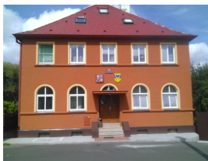
budova obecního úřadu