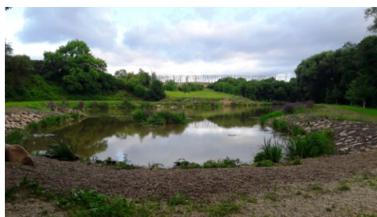
vodní nádrž Týna v Sádce