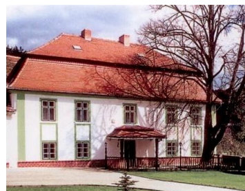
hlavní budova spol.Chmelař s.r.o.