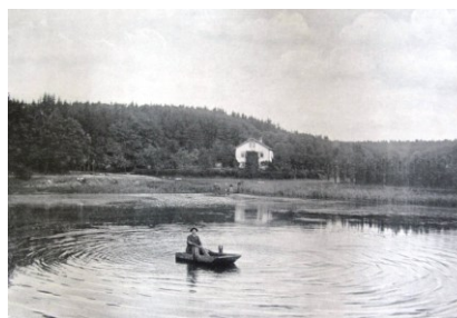
historické foto - rybník s lesovnou v Eviku