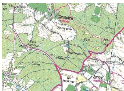
katastrální mapa - Nedvídkov

Současnost: v osadě Evik jsou dva domy, využívány rekreačně, žádný není trvale obydlen. Při příjezdu do osady je vyzděná chovná nádrž pro ryby a dále jsou zde ještě další rybníky (přes 3 ha plochy celkem). Některé jsou chovné a některé již zanikly a jsou z nich močály. Jedná se převážně o soukromé pozemky, vstup je střežen závorami.