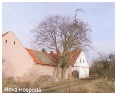
dům č.p.47 na Nové Hospodě

Ačkoliv v názvu obce je hospoda, v této vesničce hospodu nenajdete. V osadě není obchod. Autobus zastavuje na křižovatce u pískovny u Velké Černoce. Na vlak chodí občané do Deštnice. Pitnou vodu mají obyvatelé ve vlastních studnách.